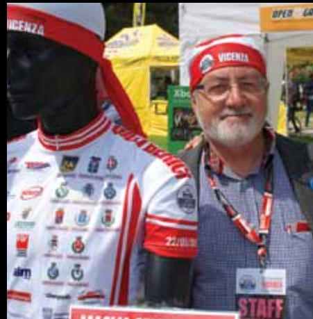
L'ASSESSORE UMBERTO NICOLAI, fondamentale riferimento per lo sport vicentino