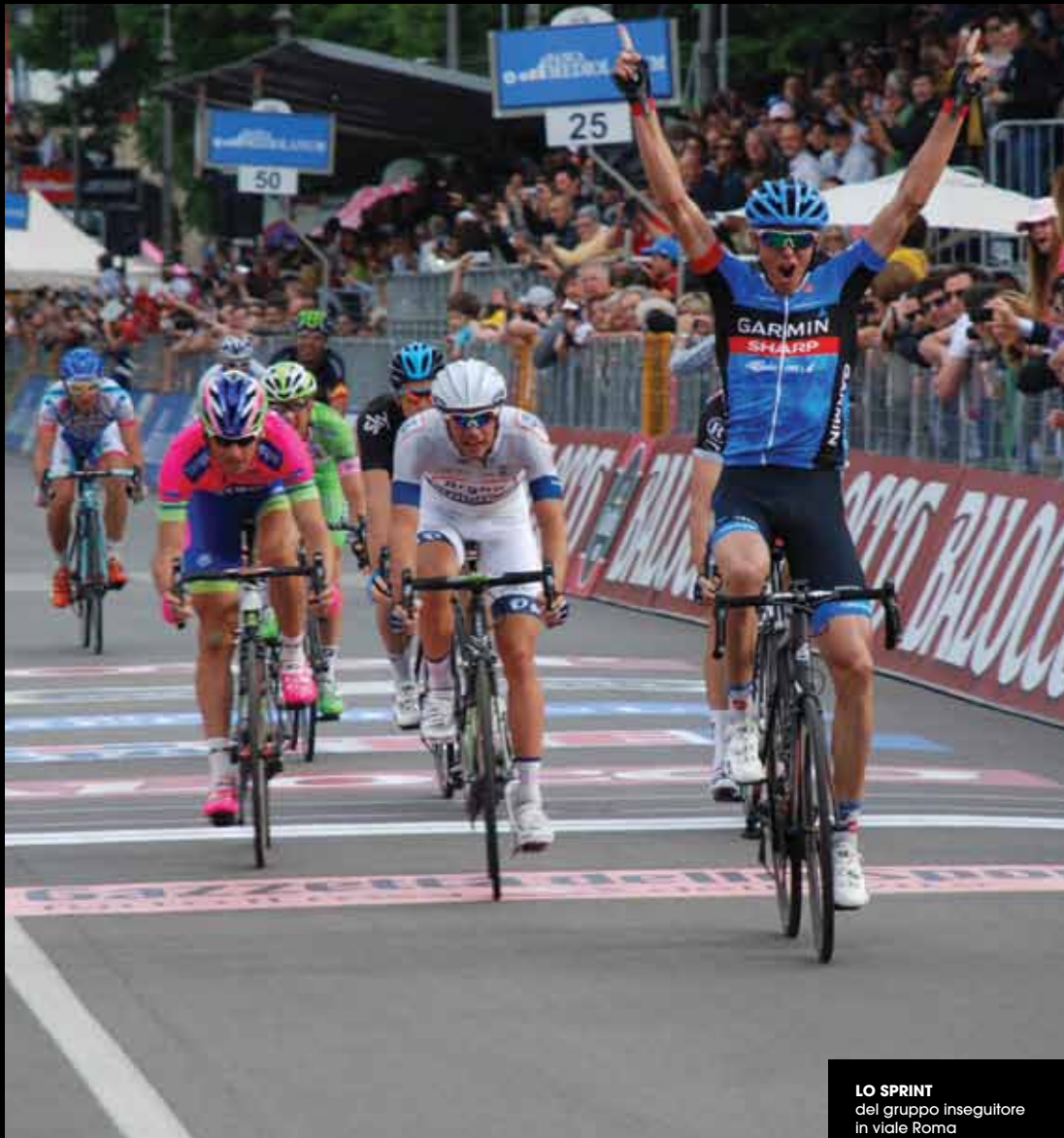
LO SPRINT del gruppo inseguitore in viale Roma

Sulle strade cittadine l'ultimo sforzo dei ciclisti del Giro d'Italia, momento culminante di una tappa spettacolare e di un progetto iniziato quasi due anni prima