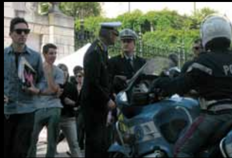
LE FORZE DELL'ORDINE hanno garantito la sicurezza lungo il percorso