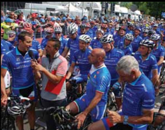
MAURIZIO FONDRIEST, PAOLO BETTINI E FRANCESCO MOSER a Vicenza