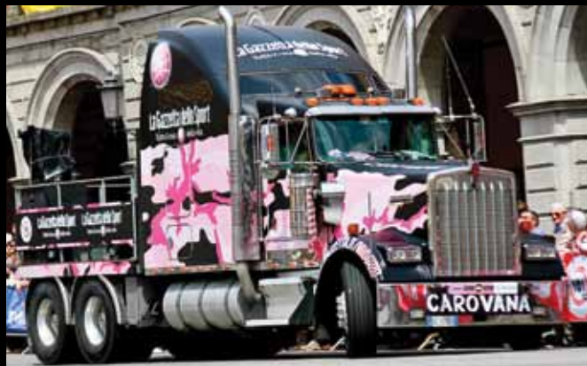
IL TRUCK della carovana del Giro