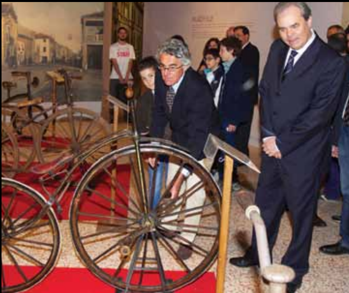
IL SINDACO DI VICENZA ACHILLE VARIATI all'inaugurazione della mostra sulle bici d'epoca in Basilica Palladiana