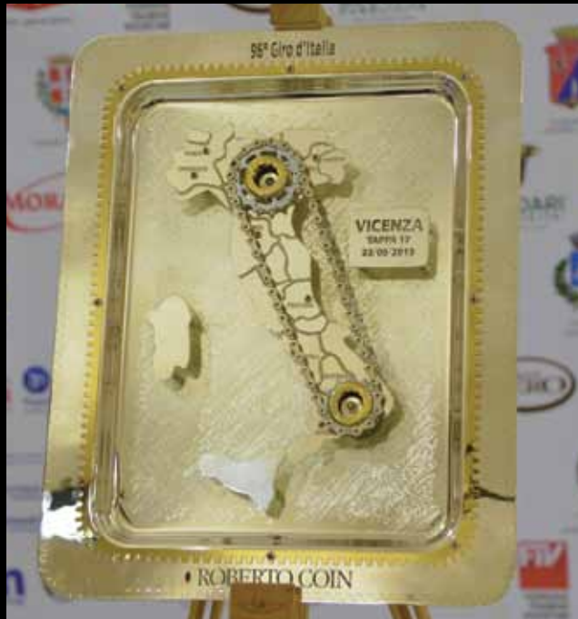
IL GIOIELLO ESCLUSIVO realizzato da Roberto Coin in occasione della tappa vicentina: sarà messo all'asta e il ricavato sarà donato in beneficenza