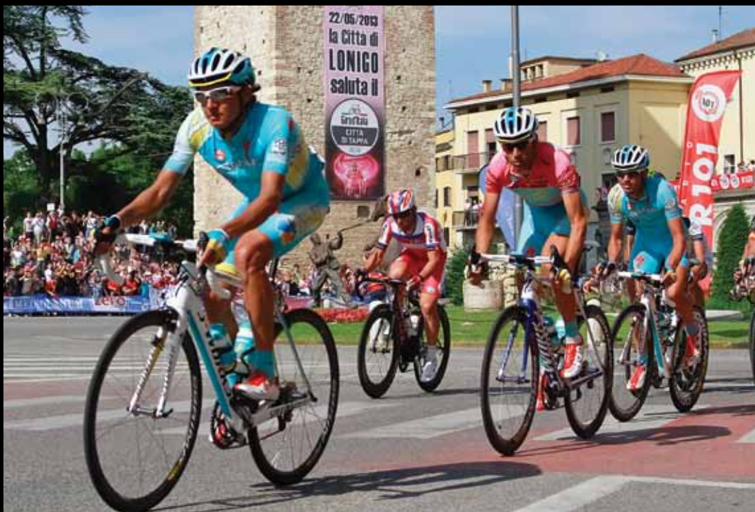
IL PASSAGGIO A LONIGO del Giro d'Italia con Nibali Maglia Rosa

Due ali di folla hanno accompagnato i corridori per i 56,7 km del percorso vicentino