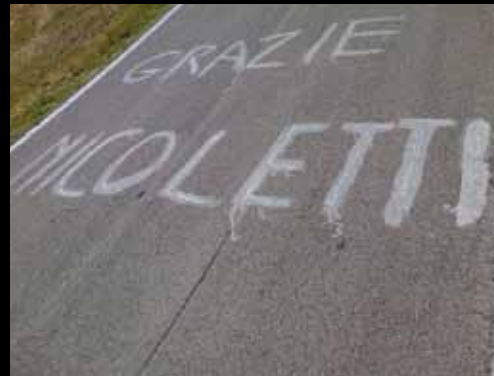
I CONCORRENTI affrontano le salite dei Colli Berici