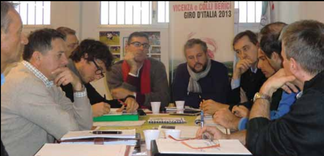
MOLTISSIME LE RIUNIONI svolte nei mesi precedenti per curare ogni dettaglio dell'arrivo del Giro d'Italia sulle strade vicentine