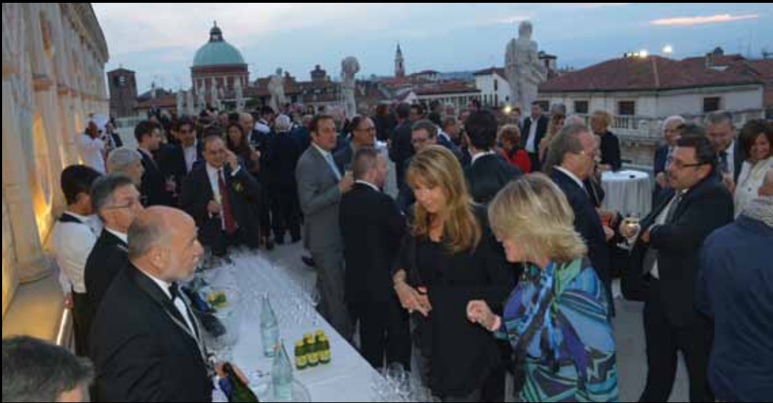
IL RICEVIMENTO UFFICIALE sulla terrazza della Basilica Palladiana

Una suggestiva mostra in Basilica, incontri con le scuole e molto altro: gli eventi collaterali che hanno coinvolto il territorio