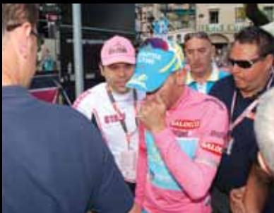
VINCENZO NIBALI è già Maglia Rosa quando arriva a Vicenza

A spingerli verso il traguardo il tifo di un'intera città che attende gli eroi del Giro d'Italia