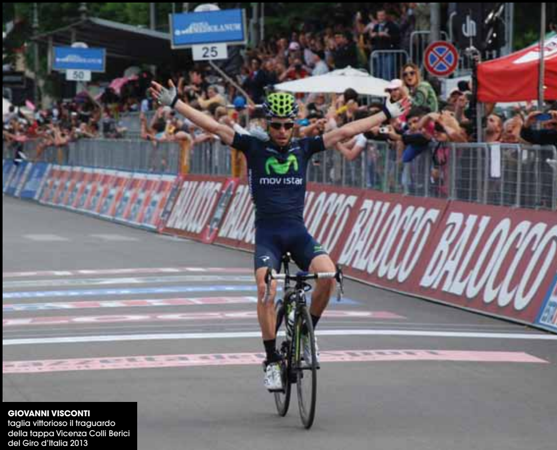
GIOVANNI VISCONTI taglia vittorioso il traguardo della tappa Vicenza Colli Berici del Giro d'Italia 2013