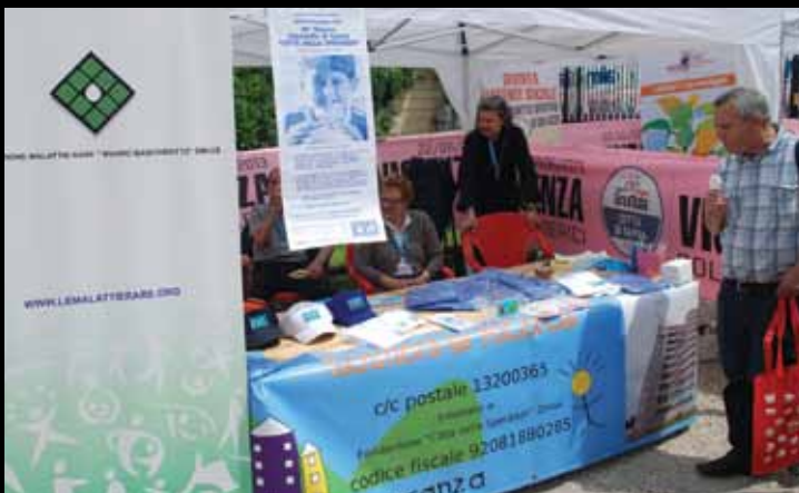
SPAZIO ANCHE AL SOCIALE ALL'ARRIVO DI TAPPA, con gli stand di Fondazione Città della Speranza, Fondazione Baschirotto, Centri Giovanili Don Mazzi e Mondo Colori

Nessuno conoscerà mai i loro nomi, eppure è grazie a loro se il sogno è diventato realtà