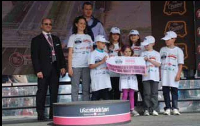
LA PREMIAZIONE di una rappresentativa scolastica del progetto FIAB-Comitato Tappa

Un percorso tutto vicentino di avvicinamento alla Tappa, per vivere pienamente un evento atteso da 17 anni