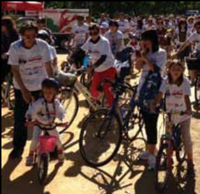
TANTISSIMI I PARTECIPANTI di ogni età alla manifestazione Tuttinbici